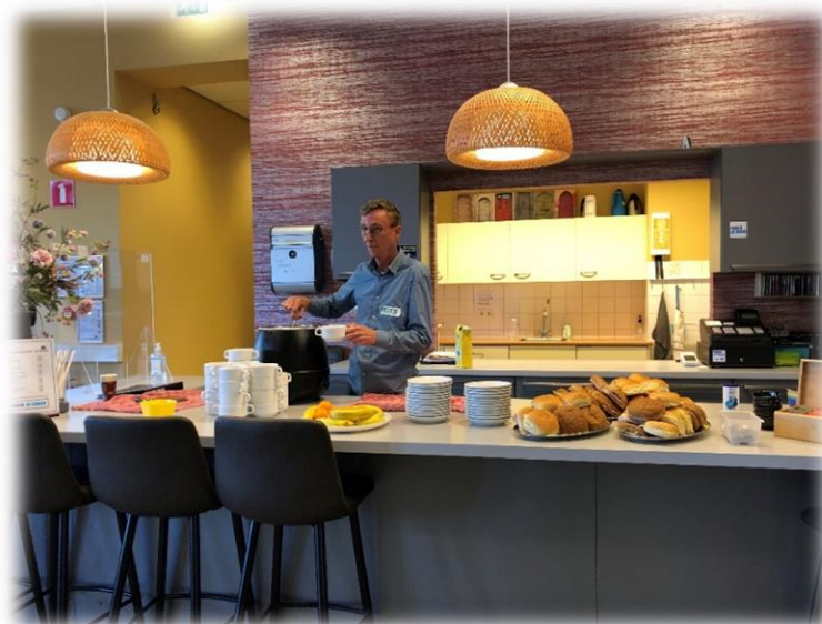
Dialogo zaterdag tijdens de week tegen de eenzaamheid. Een samenwerking met de Stadskamer, Humanitas, Coalitie Erbij Doetinchem en het 50+ Ontmoetingspunt

Ook in 2024 blijven wij zoeken naar samenwerkingspartners, waarbij wij onze doelgroep en identiteit niet uit het oog willen verliezen.