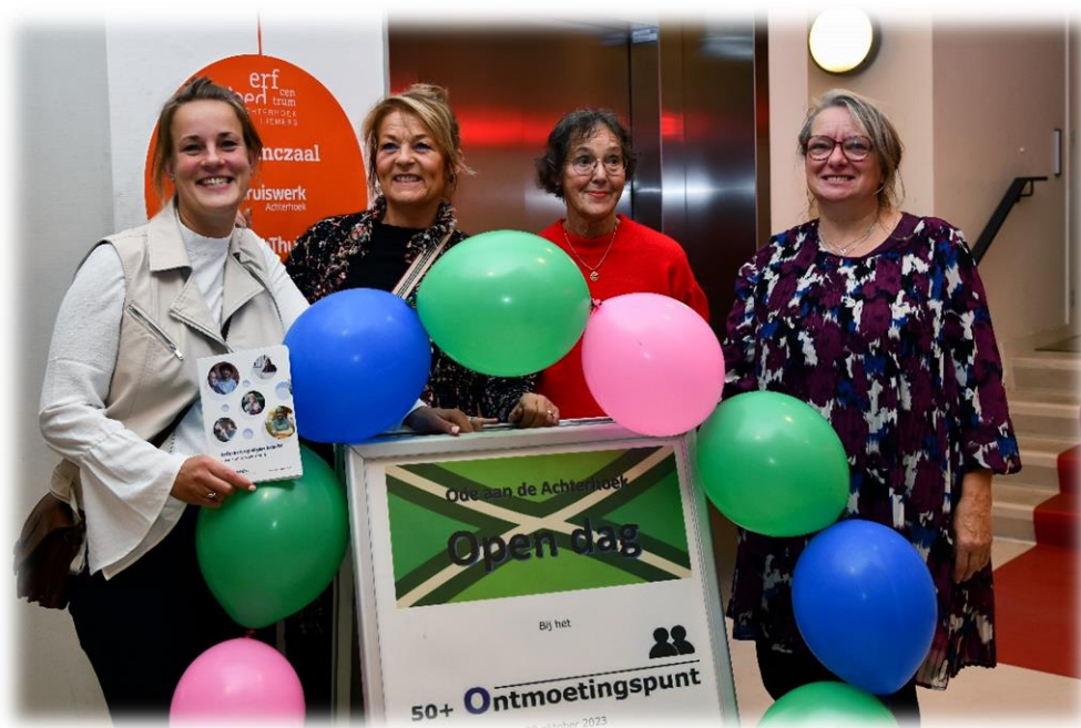
Buurtplein kwam een kijkje nemen op de Open dag

Wij hopen in 2024 weer mooie (nieuwe) activiteiten te programmeren. Er zijn genoeg ideeën die wij verder willen onderzoeken. De datum voor onze Open dag is al geprikt, over het thema wordt nog nagedacht.