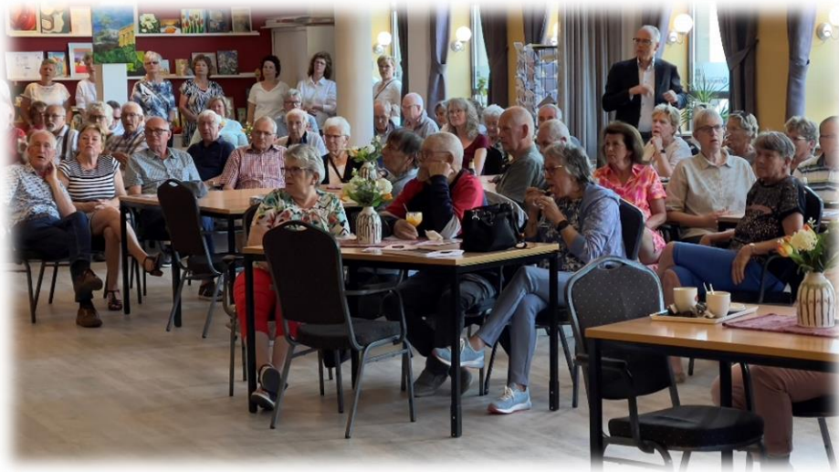
Volle zaal tijdens het korenfestival 2023

Ondanks dat wij recht hebben op het gebruik van de Brewinczaal hebben wij er dit jaar bijna geen gebruik van gemaakt. In de praktijk blijkt het heel lastig te zijn om deze te reserveren. Vaak is de ruimte al lange tijd vooraf besproken door andere organisaties. Een poging om de ruimte op een vast dagdeel te reserveren is tot nu toe mislukt.