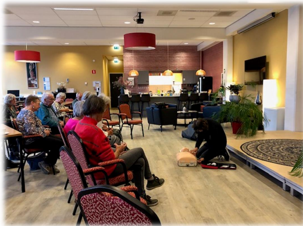
EHBO en reanimatiecursus

Ook in 2023 werd voor de vrijwilligers een cursus EHBO en veiligheid georganiseerd, door Achterkamp Bedrijfsopleidingen gegeven. De vrijwilligers hebben uitleg gekregen over het gebruik van het AED-apparaat en hiermee geoefend. Dit apparaat hangt in onze ruimte. Tevens was er uitleg en oefening over het verlenen van eerste hulp bij kleine ongevallen. Als je weet hoe je moet handelen, of juist niet, is dat een meerwaarde voor de bezoekers, maar het geeft je zelf ook een veiliger gevoel.