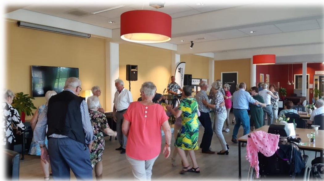
Zondagmiddag met muziek en dansen

Hoewel tijdens de zomervakantie het aantal bezoekers minder is dan in de andere maanden, zien we wel dat de behoefte aan een ontmoetingspunt steeds groter wordt. In 2023 waren er tijdens de zomervakantie meer bezoekers dan tijdens alle voorgaande jaren.