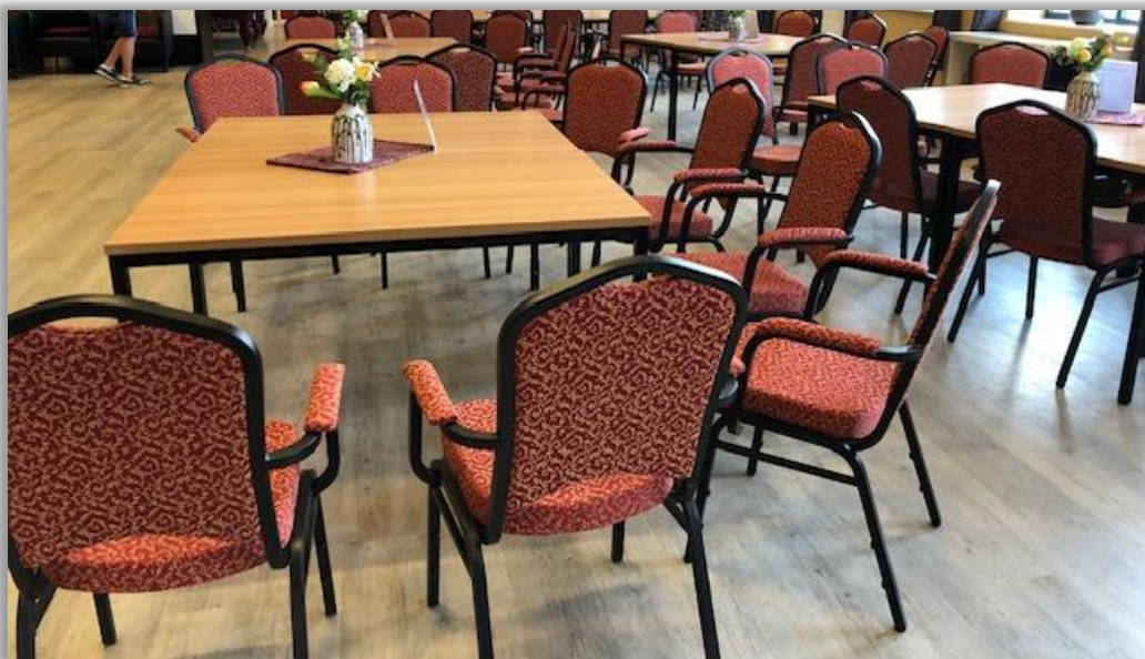
De nieuwe stoelen

Ondanks alles wisten we het 50+ Ontmoetingspunt financieel gezond te houden, mede door onze succesformule en doordat deelname aan alle activiteiten wederom is toegenomen.